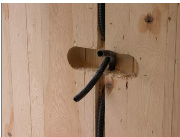
Fresatura per frutti in un pannello massiccio multistrato