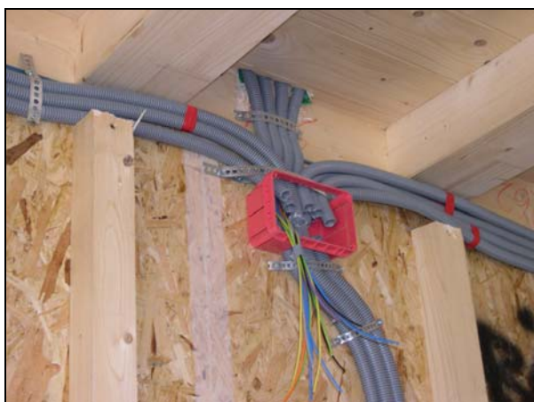
Parete con intercapedine per impianti: scatola di derivazione