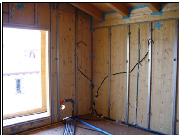
Pareti con intercapedine per impianti