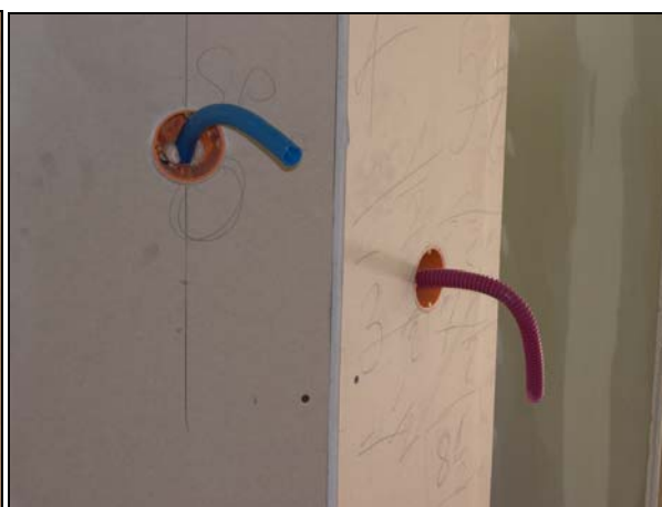
Frutti in una parete di cartongesso